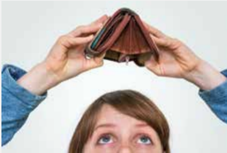
Si la empresa deja de pagar el salario, puede rescindir la relación laboral de manera inmediata.

El último salario que recibí fue el de febrero. Cuando le pregunté a mi jefa por el salario de marzo, me dijo que había dificultades para pagar. En abril seguí trabajando, pero le dije a mi jefa que necesitaba dinero para pagar mis facturas y que no podía seguir trabajando sin recibir el sueldo. Me contestó que la empresa iba a solicitar la declaración de quiebra próximamente. Ahora ya he encontrado un nuevo empleo y me gustaría cambiar de trabajo inmediatamente. En este caso, ¿puedo rescindir inmediatamente la relación laboral?