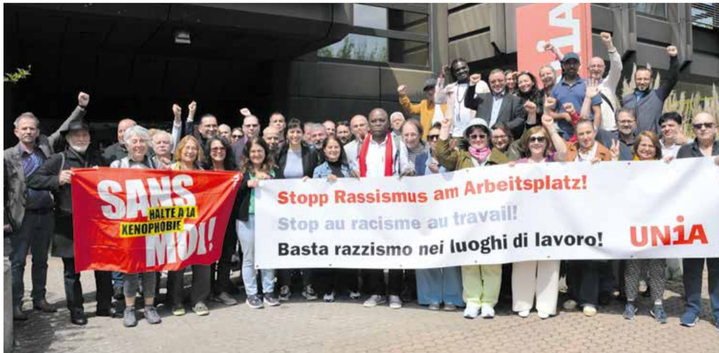
La Conferencia de Migración del Unia exige medidas eficaces frente al racismo en el puesto de trabajo

Es hora de introducir una protección eficaz contra las distintas formas de discriminación: En el empleo, la promoción, la formación profesional, el acceso a las distintas profesiones, el reconocimiento de títulos y las condiciones laborales y salariales. La Conferencia de Migración del Unia pide que se refuercen las normas penales, civiles y administrativas para luchar contra todas las formas de discriminación en el lugar de trabajo y poder intervenir desde el primer momento en el que se detecte un comportamiento de acoso, desigualdad de trato, o bien, conductas que alimentan el discurso del odio. Convenios Colectivos de Trabajo que garanticen un salario mínimo, un fácil acceso a la justicia (con mecanismos procesales coherentes, incluida la inversión de la carga de la prueba, siguiendo el modelo de la Ley de Igualdad), así como, una mayor prevención por parte de las autoridades y una campaña de información y sensibilización antirracista a escala federal, cantonal y municipal, son algunas de las medidas propuestas por la Conferencia de Migración del Unia.