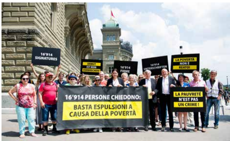
Berna, 8.6.23: Entrega de la petición «La pobreza no es un crimen»

La ayuda social es la última red de seguridad contra la pobreza en Suiza. Garantiza un nivel de vida mínimo a las personas en situación de necesidad. Pero con el endurecimiento de la Ley de Extranjería e Integración (LEI/AIG) en 2019, las personas sin pasaporte suizo corren el riesgo de ser expulsadas si reciben ayuda social. Según la Oficina Federal de Estadística (OFE), unas 745 000 personas – entre ellas más de 130 000 niños – están afectadas por la pobreza. El endurecimiento de la LEI/AIG ha hecho que, en muchos casos, las personas sin pasaporte suizo no se atrevan a solicitar ayuda social por miedo a ser expulsadas. Gracias a la aceptación de la iniciativa, esto cambiará. El Unia, al igual que el Partido Socialista y las organizaciones que han apoyado la iniciativa y la petición, ha acogido con gran satisfacción este importante logro para las personas sin pasaporte suizo. ¡Luchar merece la pena!