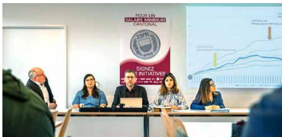
Cantón de Vaud: Por un salario mínimo cantonal de 23 francos por hora

Las iniciativas por un salario mínimo en el cantón de Vaud forman parte de una estrategia, a nivel nacional, de los sindicatos y partidos de izquierda, de cara a mantener el poder adquisitivo de las personas asalariadas y garantizar unos salarios dignos. Tras el rechazo por escasa mayoría de una primera iniciativa en el cantón de Vaud, en el año 2011, las personas defensoras del salario mínimo afirman que, dada la situación actual, las expectativas de que el cantón de Vaud se una a los cantones de Neuchâtel, Jura, Basilea-Ciudad, Ginebra y Tesino, que ya cuentan con un salario mínimo obligatorio, son buenas. Más información y pliegos para la recogida de firmas en www.salaire-minimum-vaud.ch/ .