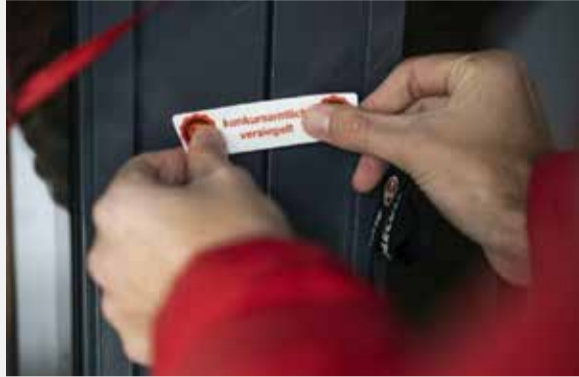
En caso de quiebra las personas empleadas tienen derecho a los salarios no cobrados.

La empresa para la que trabajo se declaró en quiebra a finales de mayo. Trabajé hasta el último día, pero aún no he recibido el salario correspondiente a los meses de marzo, abril y mayo. Estoy inscrito como desempleado desde que se declaró la quiebra y percibo prestaciones de desempleo desde entonces. Pero, ¿qué pasa con los salarios que aún me debe la empresa? ¿Trabajé «gratis» entre marzo y la declaración de la quiebra de la empresa?