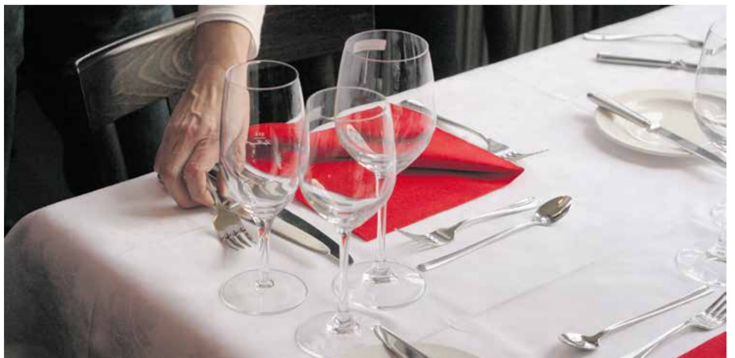
Prácticas abusivas, bajos salarios, largas jornadas etc. están a la orden del día en la hostelería-restauración

En febrero de 2023, el Unia entregó a la asociación empresarial «Gastrosuisse» un manifiesto de trabajadores y trabajadoras de la hostelería-restauración con más de 10 000 firmas. En el mismo, el personal de la hostelería-restauración exige, entre otras cosas, mejores salarios, que se dé a conocer la planilla de trabajo con la antelación suficiente, el pago de todas las horas programadas para trabajar, el derecho a no estar disponible fuera del horario laboral, así como, medidas preventivas y eficaces para proteger a las personas empleadas frente al acoso sexual y moral en el puesto de trabajo. ¡Ya es hora de que Gastrosuisse asuma sus responsabilidades!