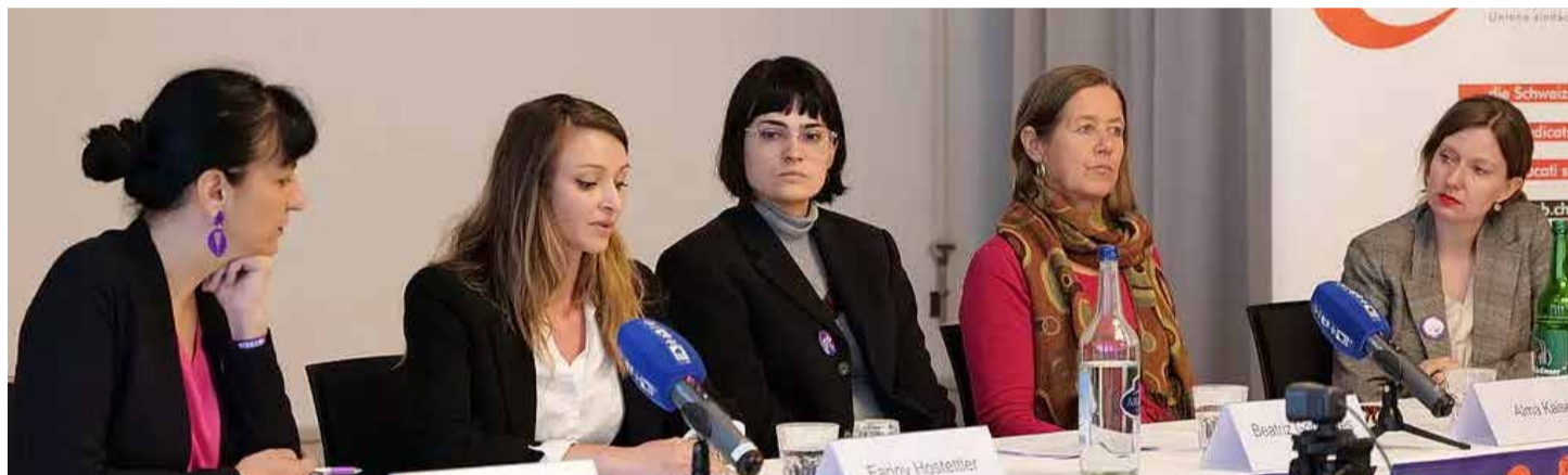
Un momento de la conferencia de prensa de la USS sobre los salarios de las mujeres.

Por ello, la Unión Sindical Suiza (SGB-USS) exige una rápida mejora de los salarios en los sectores denominados femeninos y ha presentado una serie de propuestas para paliar la situación.